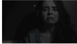
Sekans 1. 5.