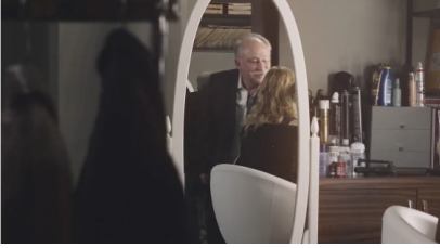
Sekans 2. 1.