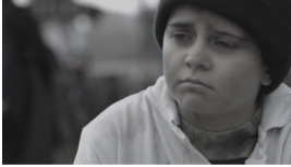
Sekans 1. 4.