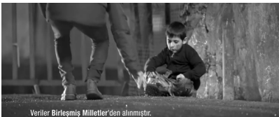
Sekans 3. 3.