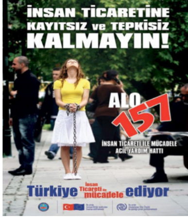
Resim 1. YİMER Kamu Spotu Reklamı

nimsenmesi gerekmektedir (Erdal, 2008, s. 89). Türkiye’de vatandaşların insan ticareti mağdurları ile karşılaştıklarında veya bir yerde insan ticareti suçunun işlendiğine dair şüpheye düştüklerinde Yabancılar İletişim Merkezini (YİMER 157) aramaları istenmektedir. YİMER bünyesinde insan ticareti mağdurlarına acil yardım sunulması amaçlanmaktadır (GİGM, 2019). YİMER, haftanın 7 günü 24 saat hizmet vermektedir. Hatta Türkçe ve İngilizce’nin dışında farklı dillerde de insanlara yardım edilmeye çalışılmaktadır. Hat ile özellikle insan ticaretine maruz kalmak üzere olan insanlara ulaşılması ve insanlara insan ticareti mağduru olmadan yardım edilmesi amaçlanmaktadır. Ayrıca insan ticareti mağduru olan insanların da güvenli olarak ülkelerine dönmelerinin sağlanmasına yönelik gerekli bilgilendirmelerin yapılması hedeflenmektedir (İçişleri Bakanlığı, 2019). Bu amaçla çeşitli şekillerde de YİMER’in tanıtımı yapılmıştır.