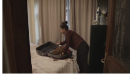
Sekans 1. 2.