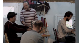
Sekans 1. 3.